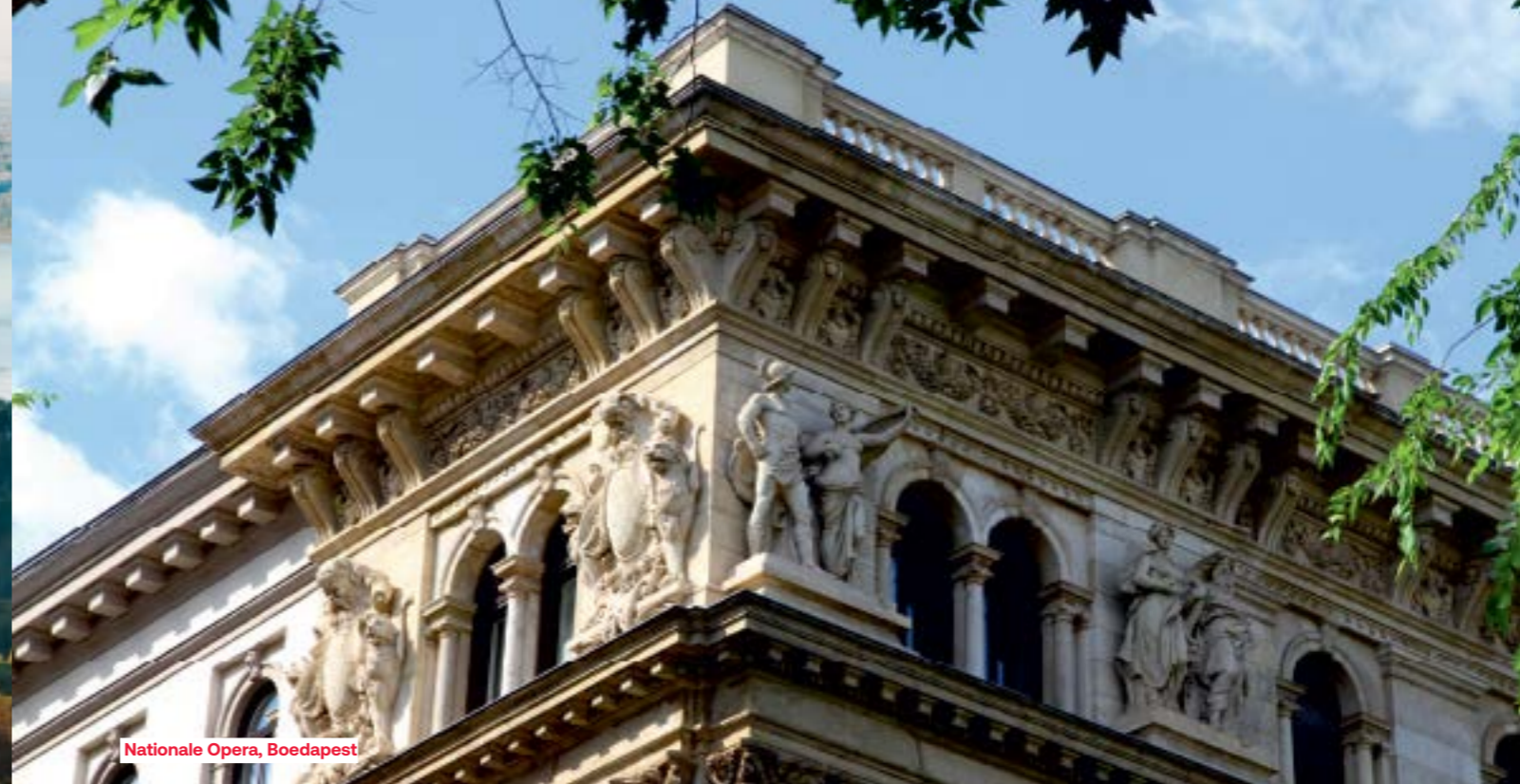
Nationale Opera, Boedapest