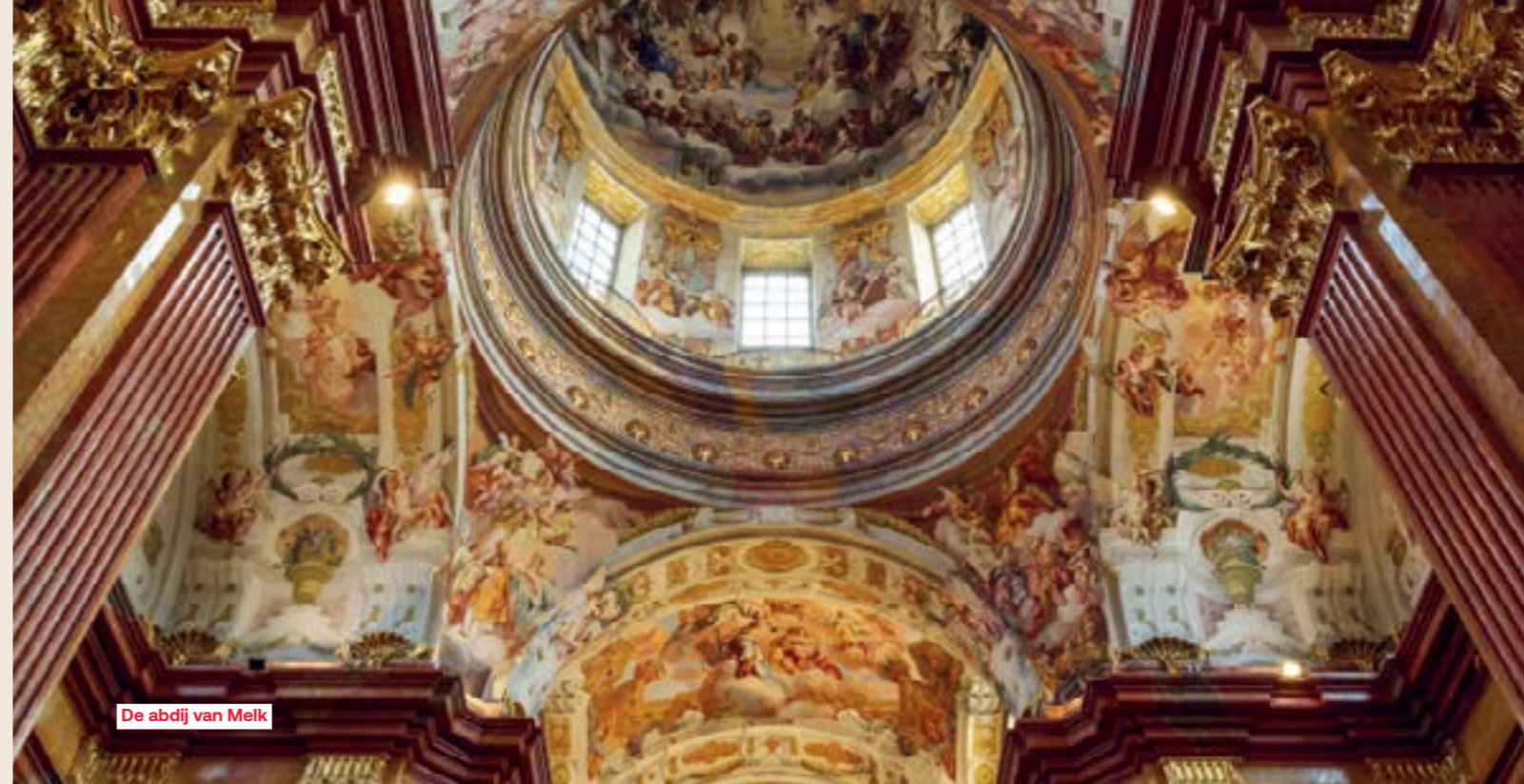
De abdij van Melk