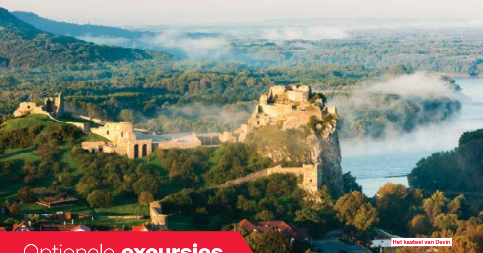
Het kasteel van Devin