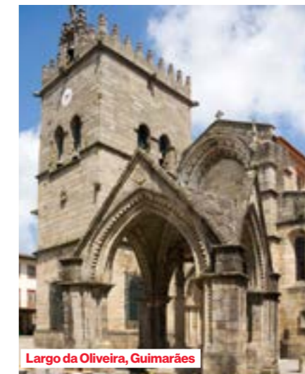
Largo da Oliveira, Guimarães

te pakken. We ontschepen na het ontbijt. Vanuit Porto wordt u naar de luchthaven gebracht. Met een lijnvlucht (met of zonder tussenlanding) vliegt u terug naar Amsterdam.