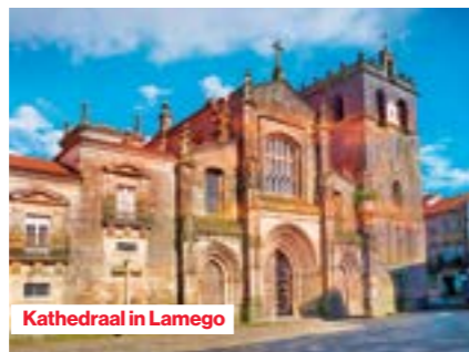
Kathedraal in Lamego

Vanaf hier vertrekken we naar Lamego. Het heiligdom van Nossa Senhora dos Remédios, een belangrijk pelgrimsoord in Portugal, domineert