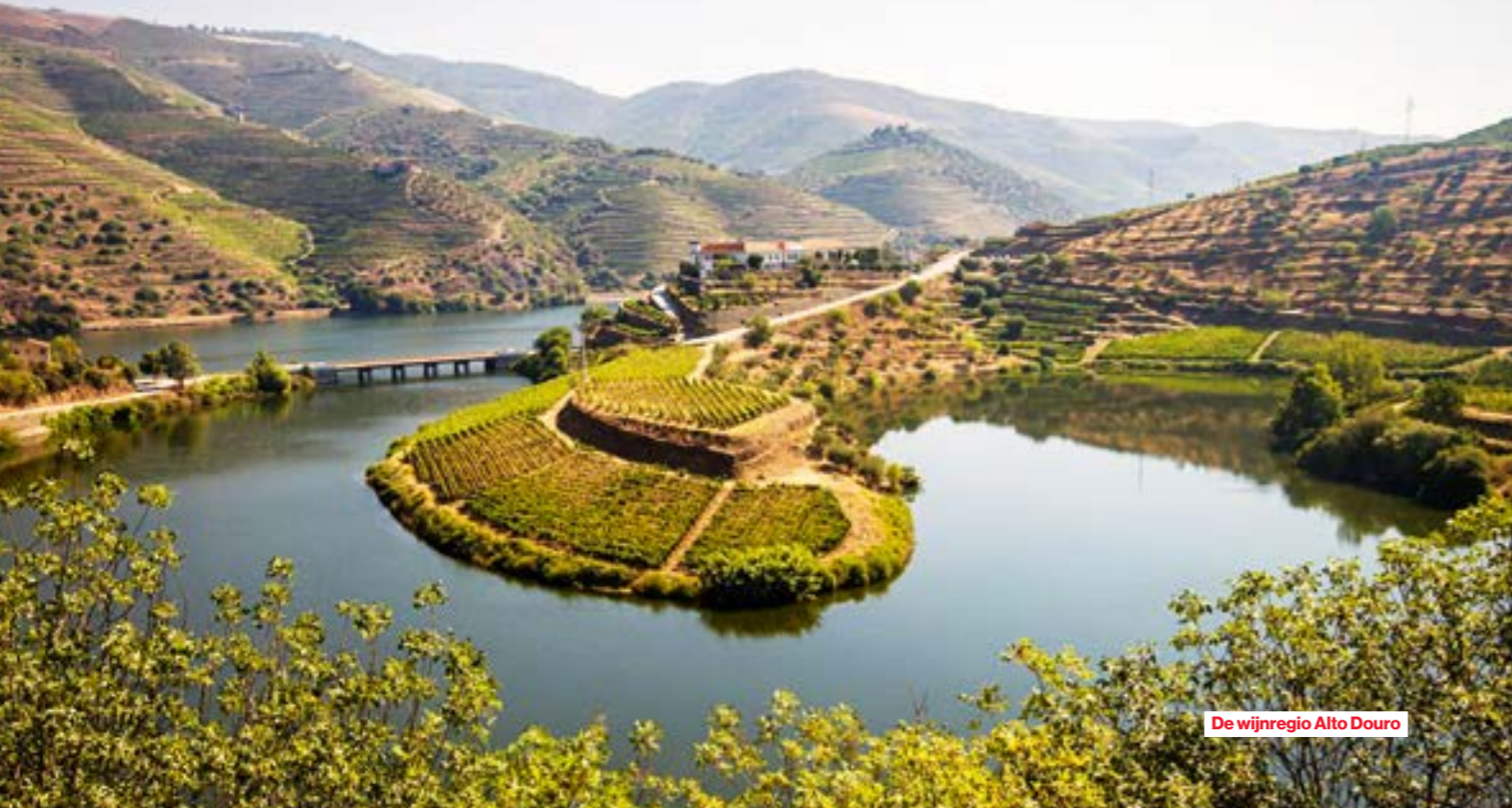
De wijnregio Alto Douro