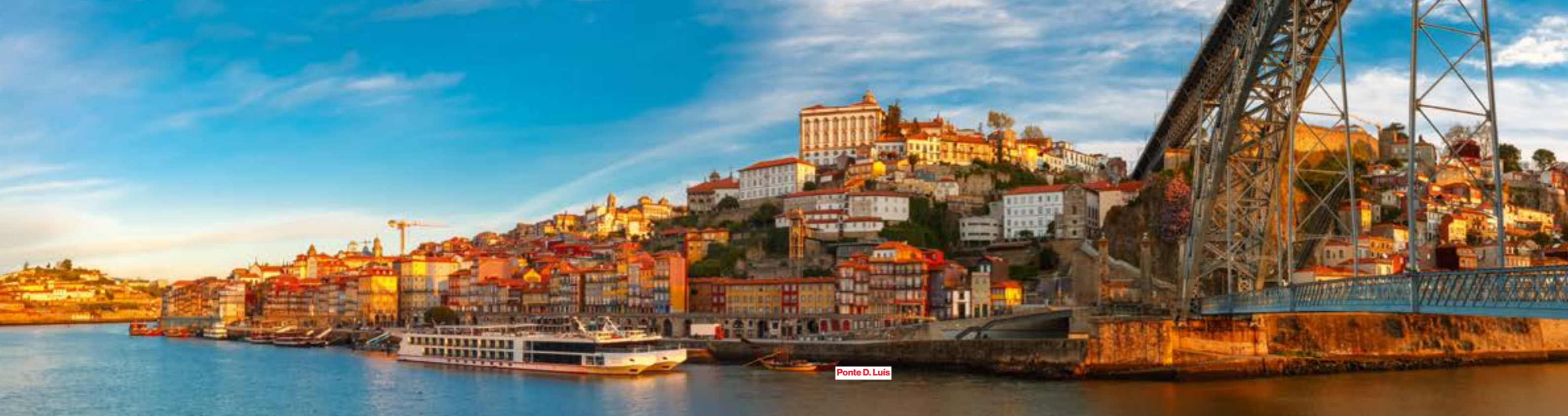
Ponte D. Luis