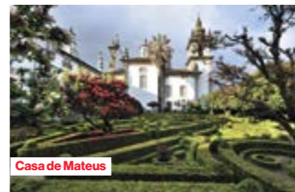
Casa de Mateus

In de namiddag vaart het schip tot Vega de Terrón, op de Spaans-Portugese grens. We varen door de diepe en steile valleien van de Douro. De rivier werd verbreed door de bouw van diverse dammen, die het stroomgebied regelen en een groot deel van de elektriciteit in Portugal produceren.