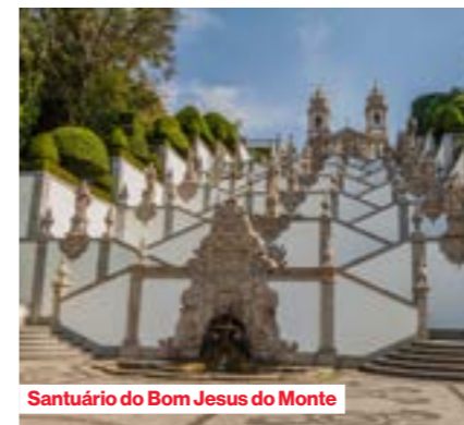
Santuário do Bom Jesus do Monte

Ontdek het voorbeeldig gerenoveerde middeleeuwse stadscentrum met een bijzondere architectonische eenheid. Een wirwar van straatjes verbindt de pleinen met